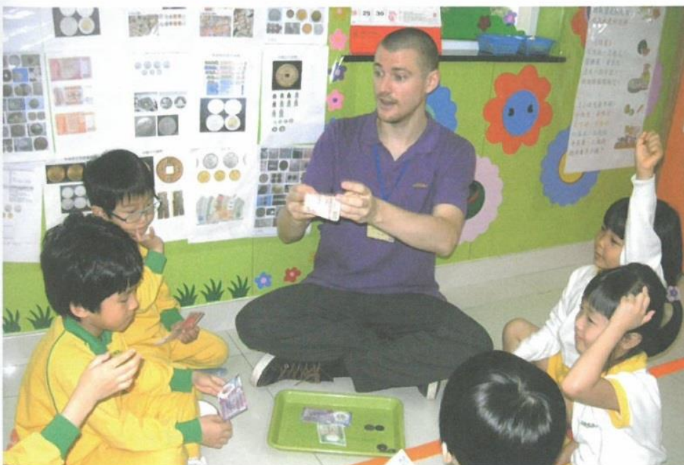
外籍老師向同學介紹不同面值的紙幣和硬幣。

以「兒童為中心」，本着基督的精神，尊重兒童的發展，重視師生互動的關係。學生是學習的主體，是以學校主張老師及家長以一位輔導者的身份來推動兒童主動學習，並以同理心去體會他們的感受，與他們保持密切而良好的溝通，建立互信互賴的良好關係，這樣就能培育出主動學習、有自信心並獨立自主的兒童，為其終身學習作好準備。