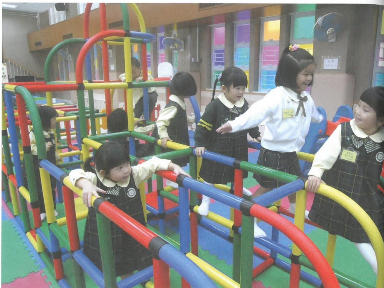
學校時刻重視小朋友的體能訓練。

電話：2546 2863 | 傳真：2546 2826 | 網址： http://www.sack.edu.hk