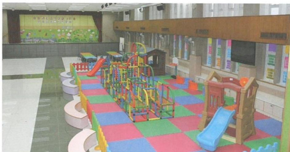
學校偌大的禮堂供早會及活動之用。

聖公會聖士提反堂建基於一八六五年六月廿四日，開創至今已一百四十五年，是香港聖公會第一間華人教會，除努力開拓福音事務外，並興辦教育，藉此廣傳福音，讓兒童及家長認識主耶穌基督。